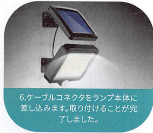
6.ケーブルコネクタをランプ本体に差し込みます。取り付けることが完了しました。

物でソーラーバッテリープレートを隠し、周りの光線を遮り、ライトが光るかどうかをチェックできます