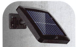
4.ソーラーパネルをベースに取り付けます