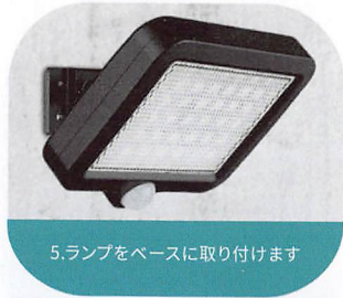
5.ランプをベースに取り付けます