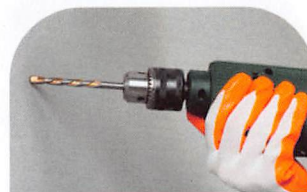
1.各穴の位置を確認後、6mmドリルを使用して穴を開けます