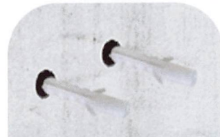
2.壁の穴にプラグを差し込みます